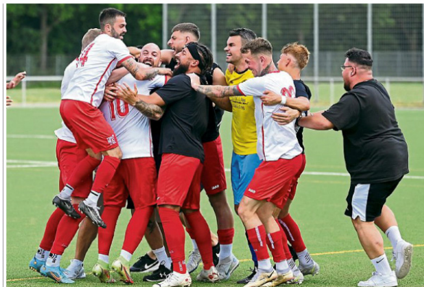
Die Spieler der Sportvereinigung Porz feiern nach 16-jähriger Abstinenz die Rückkehr in die Mittelrheinliga.

Die SpVg. Porz hat sich trotz der wirtschaftlichen und gesellschaftlichen Folgen der Corona-Krise, die auch den Verein unmittelbar trafen, in den letzten Jahren (wieder) zu einem der größten und attraktivsten Vereine der Region entwickelt. Durch die erhöhte Präsenz in den Medien zieht die SpVg. Porz das Interesse einer breiten Öffentlichkeit auf sich. Eine Plattform für zukünftige Sponsoren ist damit vorhanden. Der Verein ist ein interessanter Werbeträger. Um die Attraktivität bewahren zu können, muss jedoch der Erfolg des Vereins auch langfristig gesichert werden. Nur wer erfolgreich ist, wird beachtet und ist interessant.