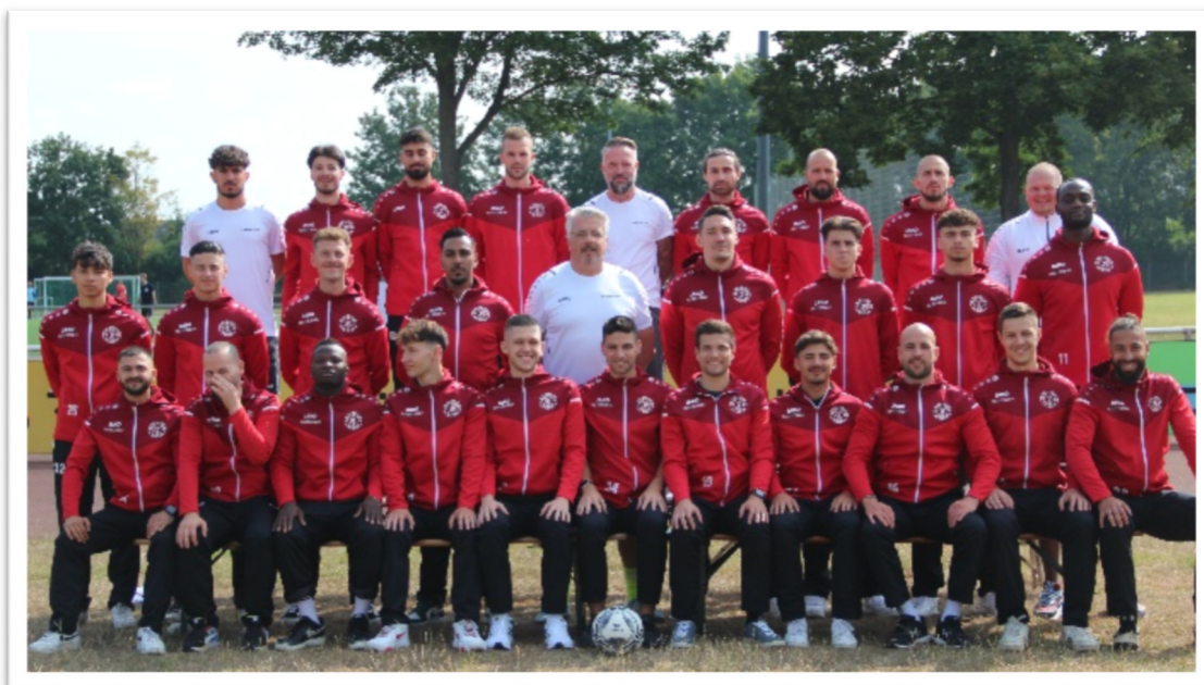
Die 1. Mannschaft der SpVg. Porz in der Aufstiegssaison 2022/23

Mit der guten Infrastruktur und dem idealen Standort des Fußballplatzes sind die Grundlagen für eine erfolgreiche Tätigkeit geschaffen. Im Standort liegt auch im Hinblick auf Sponsorenwerbung (Transparente, Werbepaneele usw.) ein großes Potenzial. Das Marketing der SpVg. Porz wird z. Zt. neu organisiert. Wir werden das vorhandene Potenzial mit innovativen Angeboten ausschöpfen. Unabhängigkeit wird bei der SpVg. Porz großgeschrieben.